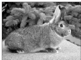
1,0 činčily malé z chovu Jana Vycpálka.

Vystavovali: Bělík - 96; 95; 95,5; 95 b.; kolekce 381 bodů Danišovičová - 96; 95,5; 96; 96 b.; kolekce 383,5 bodů Fasora - 97; 96; 96; 94,5 b.; kolekce 383,5 bodů – čestná cena Vančat - 97; 96,5; 96; 97 b.; kol. 386,5 bodů – 2x čestná cena