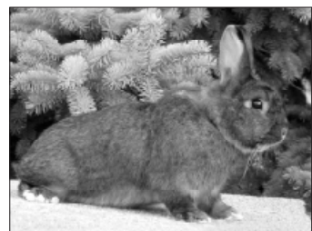
1,0 dailenára z chovu Jana Dvořáka.

Jak již bývá téměř tradicí, tak speciální výstava se uskutečnila opět v překrásném areálu ve Slavkově u Brna. Vystaveno a dodáno bylo 111 Čm a 22 DI. 2 zvířata nebyla hodnocena – byla vyloučena. Bodový průměr činil u Čm 93,768 bodů a u DI 93,5 bodů. Zvířata posoudil př. Šitar a Jurečka. V letošním roce dle mého názoru byly kvalitnější samice. U mnoha zvířat se projevil nedostatek ve struktuře srsti – vlivem línání, velký pokrok nastal v utváření zádě